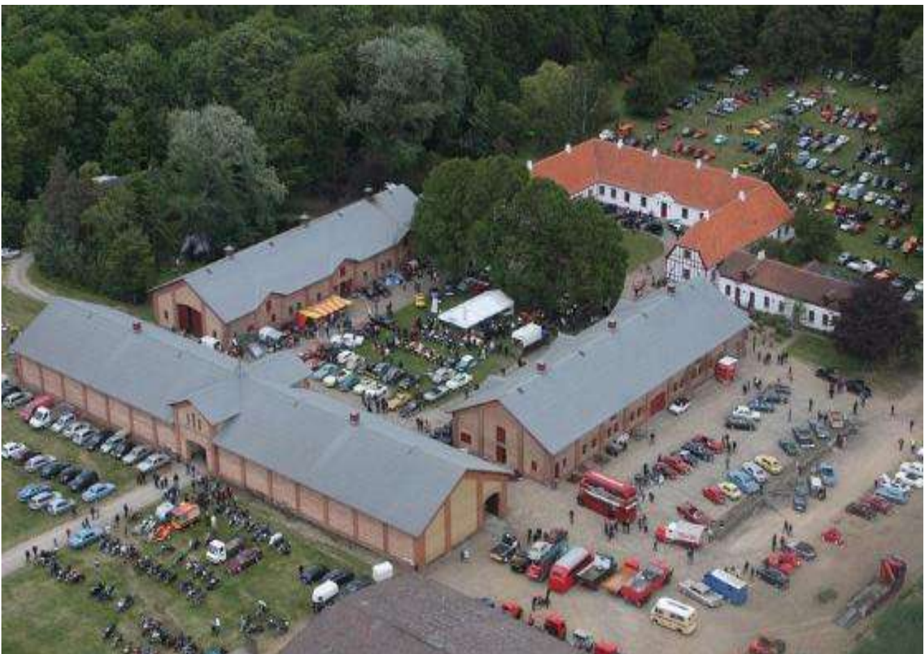
Veterantræf og modelflyveudstilling på Wedelslund i 2012

Flyvning på årets sidste dag Protokol fra generalforsamling Konstituerende bestyrelsesmøde Bestyrelsens årsberetning Referat af bestyrelsesmøde