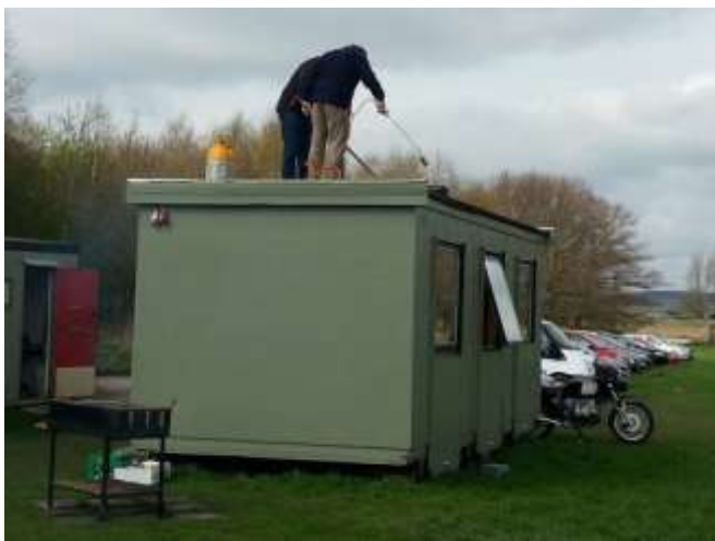
Blæselamper og vovemod skulle der til for at tætne taget.