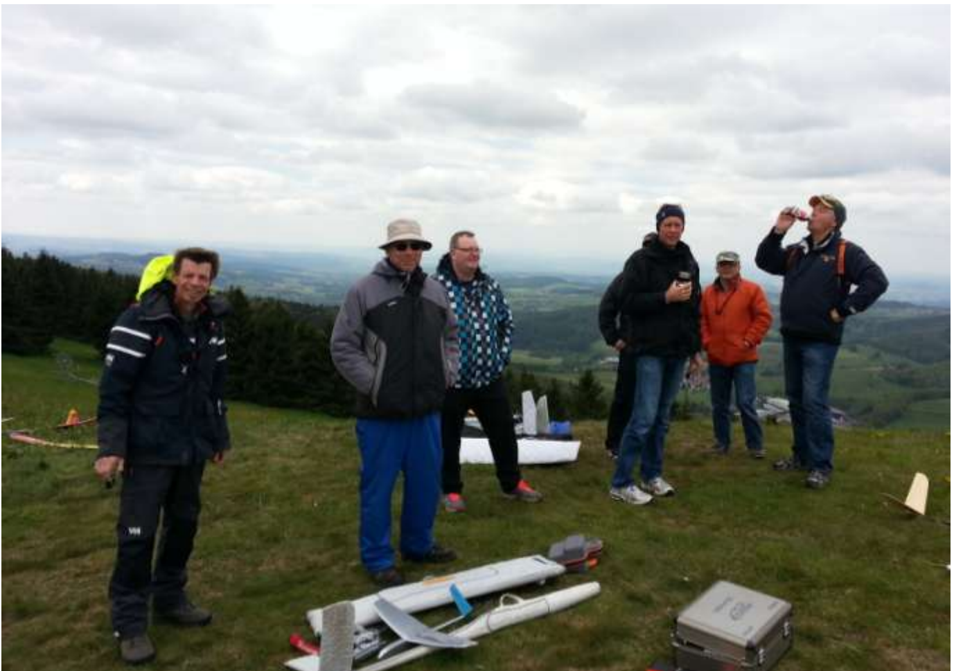
Et udsnit af det glade hold på Wasserkuppe i maj

AMC open – F5J Pingvin flyvning Onsdags klubaftener Næste halvleg Referat af bestyrelsesmøder Nye medlemmer Opdateret kalender