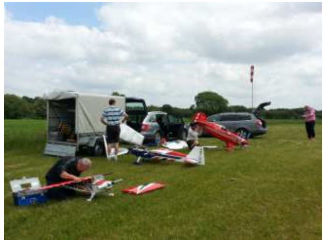
Silkeborg modelflyveklub (ikke el og svæv) har fået ny flyveplads. Dejlig øde placering ved Stenrøjl. Vi var en delegation på besøg for at prøve pladsen.