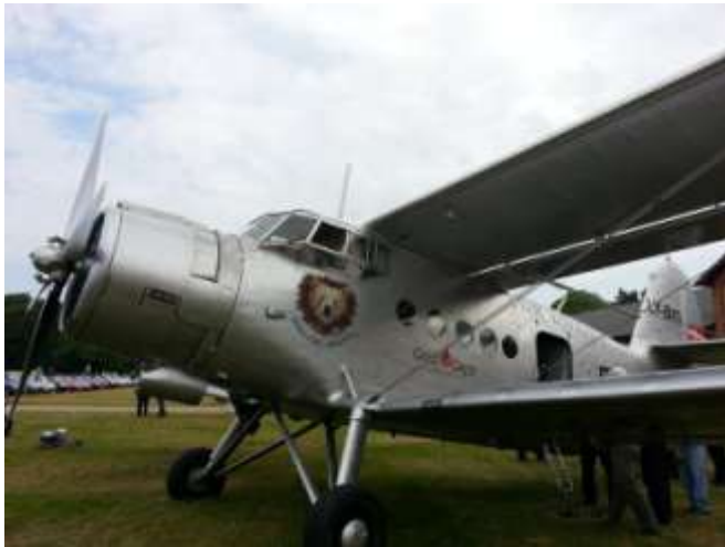
Antonov AN2 - 1 motor 1000 Hk på besøg på veteranudstillingen på Wedelslund. Dansk registreret.