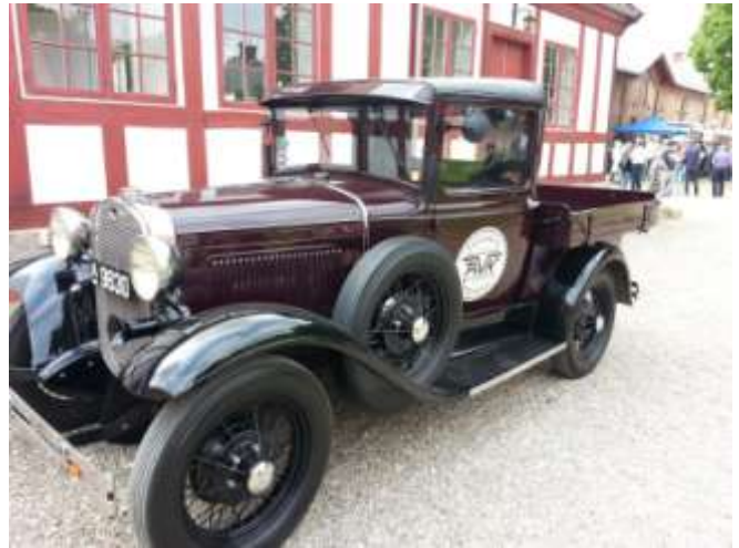
Grisehandler Larsen kiggede også forbi.