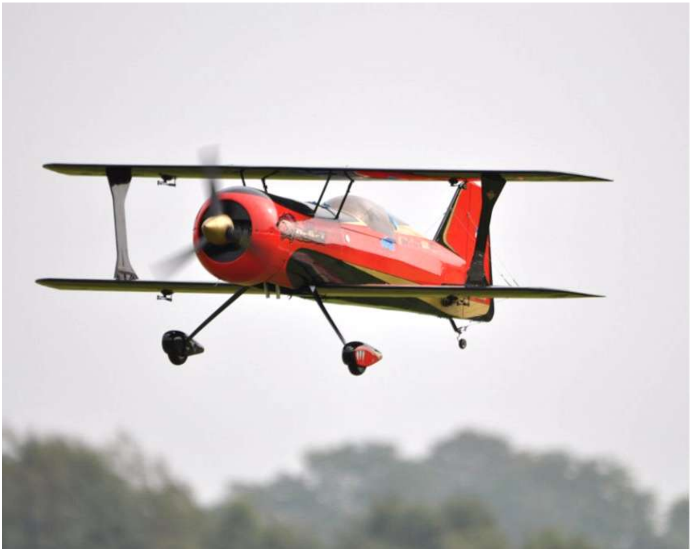
Henrik Jørgensens Beast, som fik godt med gas under opvisningen.

Fra standerstrygning Fra festugeflyvning