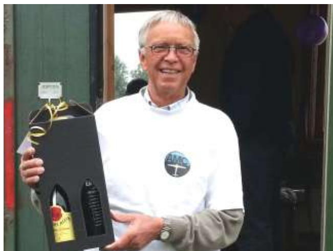
Man får vel smave en Gammel Dansk